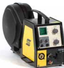
Origo™ Feed 304/484 (19 polig).